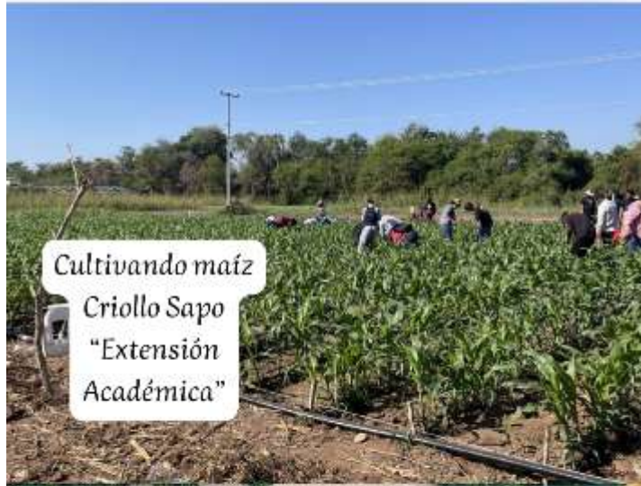
Cultivando maíz Criollo Sapo "Extensión Académica"

REVISTA MULTIDISCIPLINARIA DE CIENCIAS TECNOLÓGICO NACIONAL DE MÉXICO / IT CIUDAD ALTAMIRANO